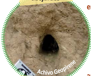
Nido de abejaruco