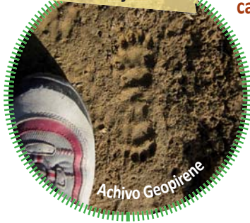
Huellas de tejón