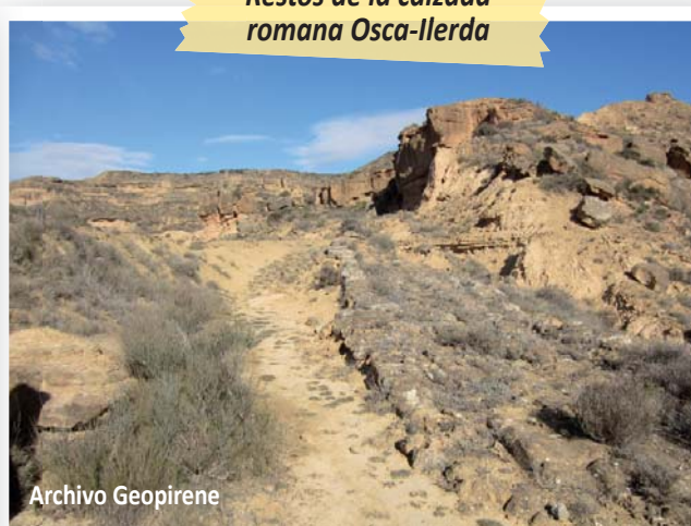
Restos de la calzada romana Osca-Ilerda