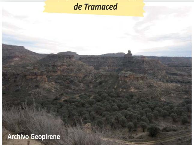
Panorámica de la Serreta de Tramaced

en altura, contando aspectos sobre los materiales que forman los montes y resaltes que nos rodean. Esta senda comparte trazado con la antigua calzada romana Osca-Ilerda, de la que todavía quedan algunos restos. Aprenderemos la importancia que tenían las calzadas y cómo se construían. Seguiremos el recorrido a los pies de los escarpes de areniscas observando en las rocas algunas de las pistas de su formación, como la presencia de antiguos paleocanales, que nos indican que nos encontramos en un antiguo ambiente fluvial. Llegaremos al enlace con el camino de las Cuevas, desde donde tendremos una amplia panorámica de las Sierras Exteriores. Desde allí regresaremos por el mismo camino de ida hasta la carretera y nos dirigiremos al desvío hacia la Peña de Mediodía y por un pequeño caminito accederemos hasta la antigua fortaleza musulmana, el Castillo de Piracés. Una vez en lo alto contaremos pasajes de la historia de esta magnífica fortaleza natural que, como el resto del paisaje, muestra importantes efectos de la erosión. Regresaremos a Piracés para terminar allí la ruta.