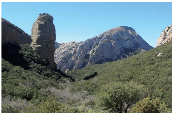
“El Huevo” y Aguja de Nummery