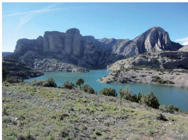
Vistas de los Mallos de Ligüerri y Pico el Borón