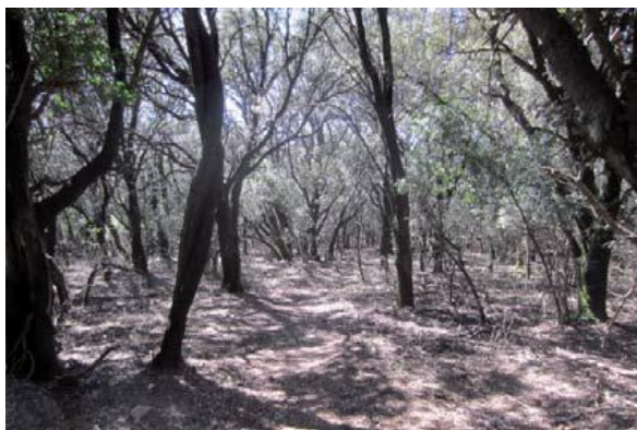
El Bosque Encantado