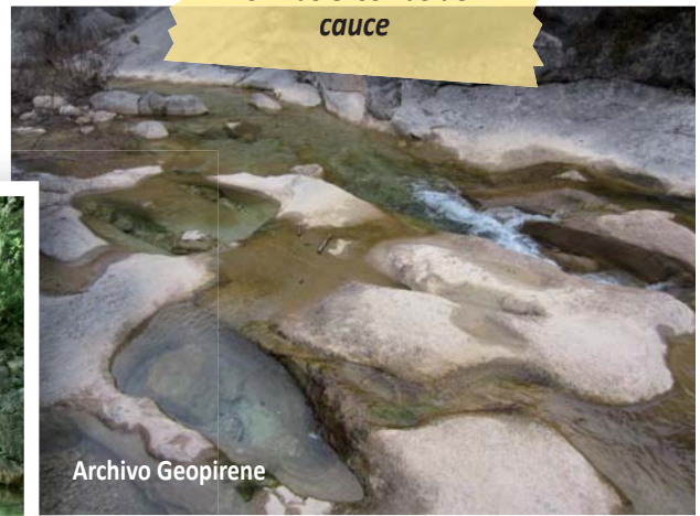
Formas erosivas del cauce

Si seguimos por el barranco llegaremos a la Badina de Estañero, un rincón espectacular, en la confluencia de dos barrancos (Abellada y la Pillera) donde se forma una badina de aguas cristalinas.