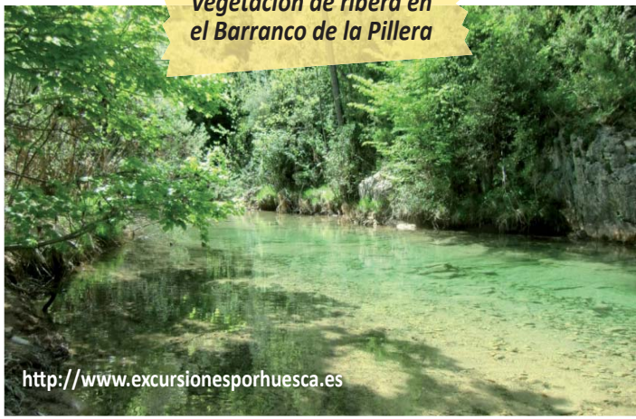
Vegetación de ribera en el Barranco de la Pillera

nummulites, un pequeño organismo con concha calcárea muy abundante en los mares del Eoceno (hace unos 40 millones de años). Además por esta zona el agua del barranco genera unas formas erosivas muy llamativas en las rocas del cauce.