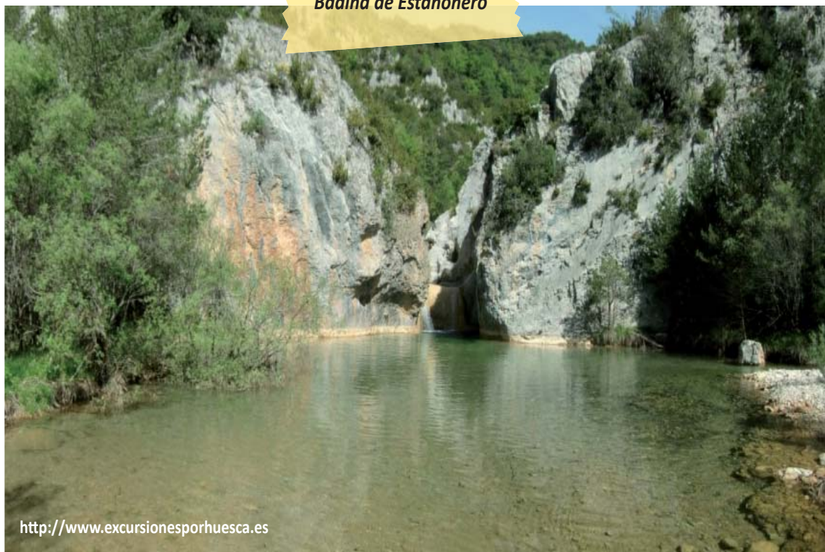
Badina de Estañero

Este es un lugar ideal para tomar un refrigerio, e incluso de un refrescante baño en verano, disfrutando del maravilloso entorno. Más arriba nos encontraremos la Cueva del brazo de mar, una cueva inundada y que forma parte de la infinidad de cuevas que hay en la zona debido a que gran parte del terreno está formado por las rocas calizas, que se disuelven muy fácilmente. Al final llegaremos a la Fuente de Fuendegaril, lugar donde termina el recorrido y donde daremos media vuelta para volver por el camino de ida.